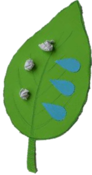
Obr. 2: Zelený list s modrými kapkami (voda) a bílými kuličkami (oxid uhličitý).