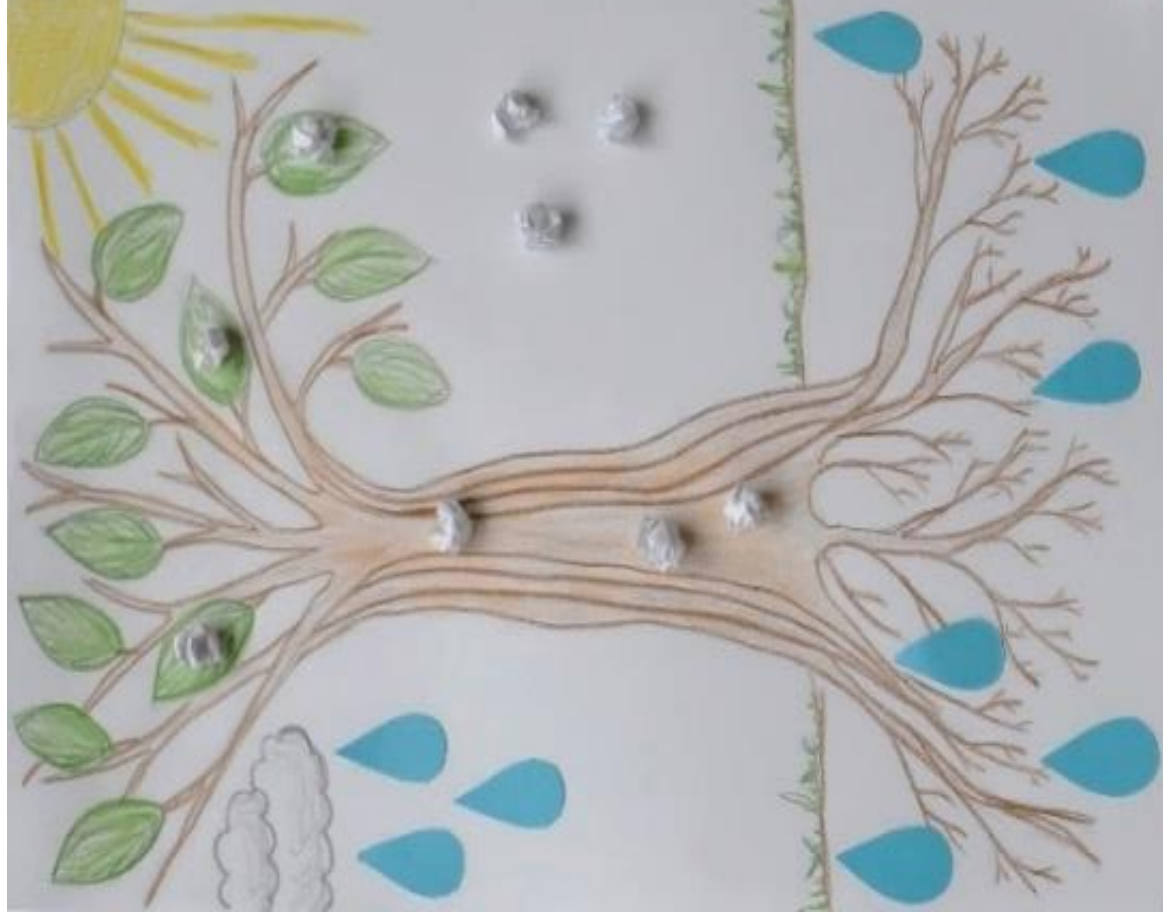
Obr. 3: Fotosyntetizující = rostoucí strom